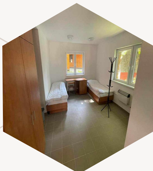
Új bútorok, komfortos szobabelső