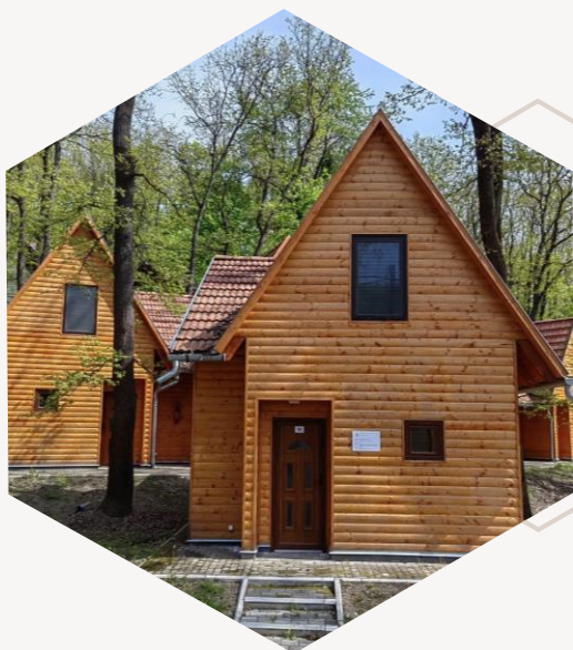
7 új faház